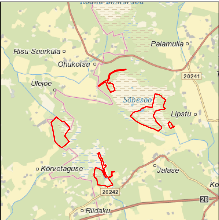
Kaardileht nr 631 Rapla